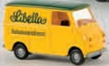
v 27956 Goggo TL Kasten „Libella“