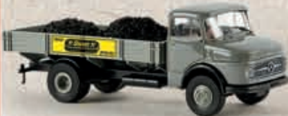
v 47023 MB L 322 „Union Briketts“ mit Ladegut