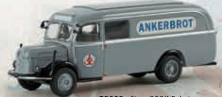
58009 Steyr 380/I Paketwagen „Ankerbrot“