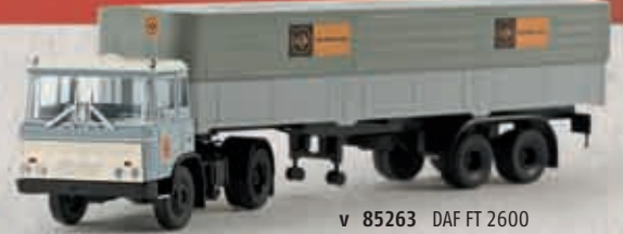
v 85263 DAF FT 2600 „van Gend & Loos“