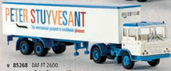
v 85268 DAF FT 2600 „Peter Stuyvesant“