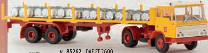
v 85262 DAF FT 2600 „Shell“ mit Ladegut