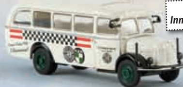
n 58004 Steyr 380/II Werkstatwagen „Steyr Puch Team“