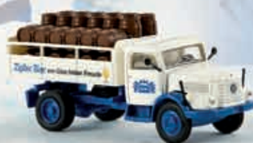
58033 Steyr 480 „Zipfer Bier“