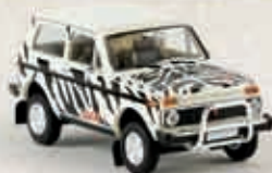
v 27216 Lada Niva „Safari“, TD