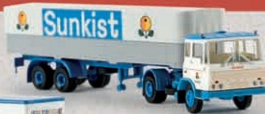
v 85271 DAF FT 2600 „Sunkist“