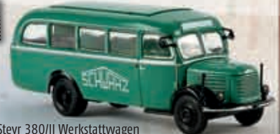
n 58006 Steyr 380/II Werkstatwagen „Schwarzbau“