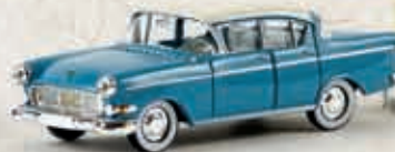
v 20837 Opel Kapitän mit Eriba-Wohnanhänger, TD