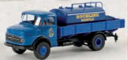
v 47022 MB L 322 mit Aufsatz-Tank „Röchling“