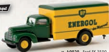
v 49020 Ford FK 3500 „BP Energol“