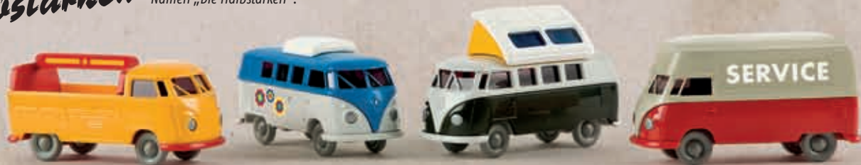
v 13900 Set „VW Bulli“ mit vier Modellen