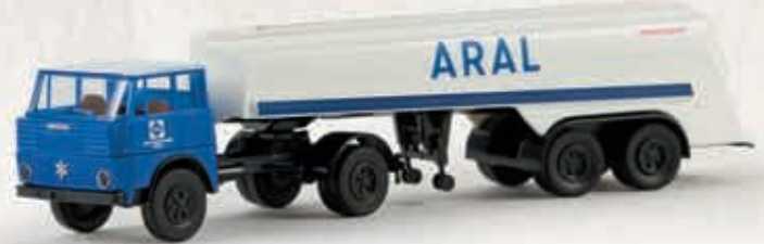
82205 Henschel HS 16 TS „Aral“