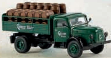
58035 Steyr 380/I „Gösser Bier“