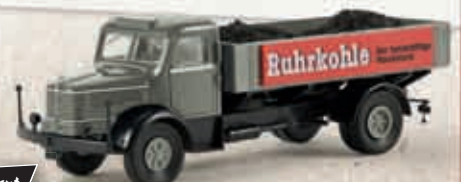
v 77139 Krupp Mustang „Ruhrkohle“ mit Ladegut