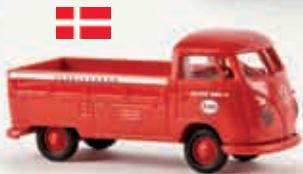
v 32961 VW Pritsche T1b „Esso“ (DK)