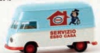
32609 VW Großraum-Kasten T1b „Esso Casa Servizio“ (I)