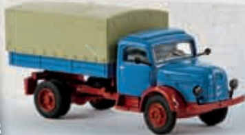
v 58036 Steyr 380/I, brillantblau/rubinrot