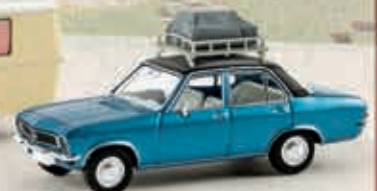
v 20376 Opel Ascona A mit Dachgepäck, TD