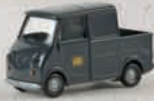
v 27906 Goggo TL Pick-up „DB“