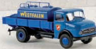
v 47021 MB L 322 mit Aufsatz-Tank „Westfalen“