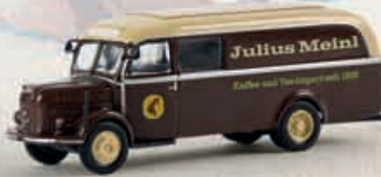
58008 Steyr 380/I Paketwagen „Julius Meini“