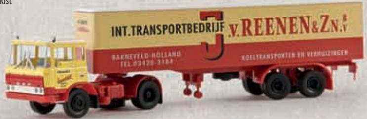
v 85265 DAF FT 2600 „van Reenen“