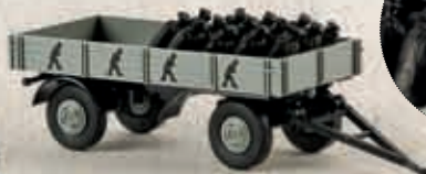
v 55238 Leichtanhänger „Kohle“ mit Ladegut