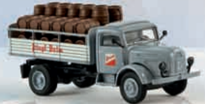
58034 Steyr 380/I „Stiegl Bräu“