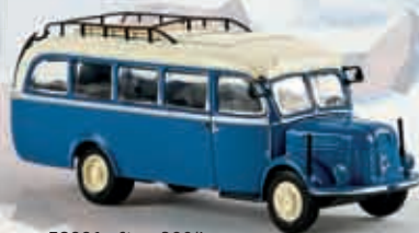
v 58001 Steyr 380/I, capriblau/hellelfenbein