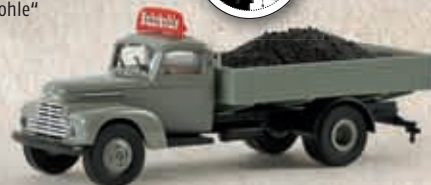
v 49023 Ford FK 3500 „Ruhrkohle“ mit Ladegut