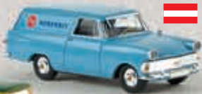
v 20173 Opel P2 Kasten „Semperit“ (A)