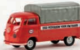
32951 VW Pritsche T1b „Esso“ (NL), TD