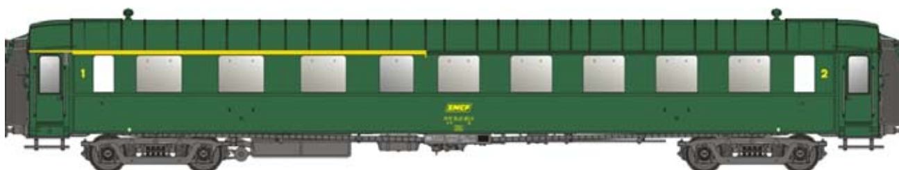
New 40 219 OCEM A3½B5, vert, châssis gris, logo encadré jaune, numéro UIC Ep.IVA