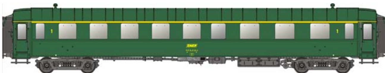
Rerun 40 217 OCEM A8½, caisse et toit vert, châssis gris, logo encadré jaune, numéro UIC Ep.IVA