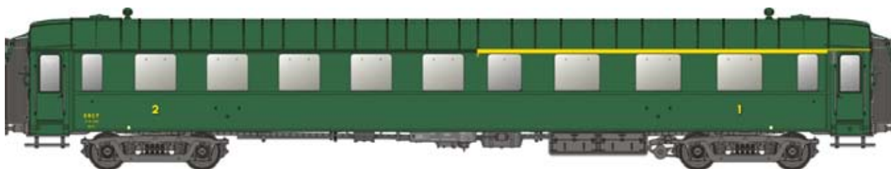
New 40 218 OCEM A3½B5, vert, châssis gris, toit et bouts vert, marquage 1964 Ep.IIID