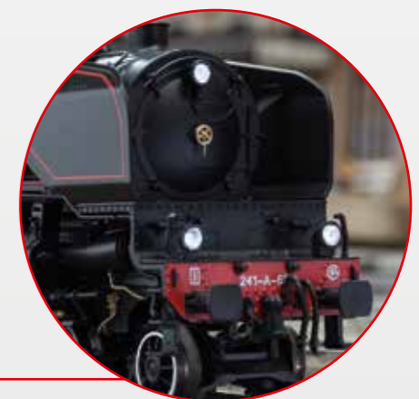
Eine Lok wie ihre Zeit... Gigantische Schönheit