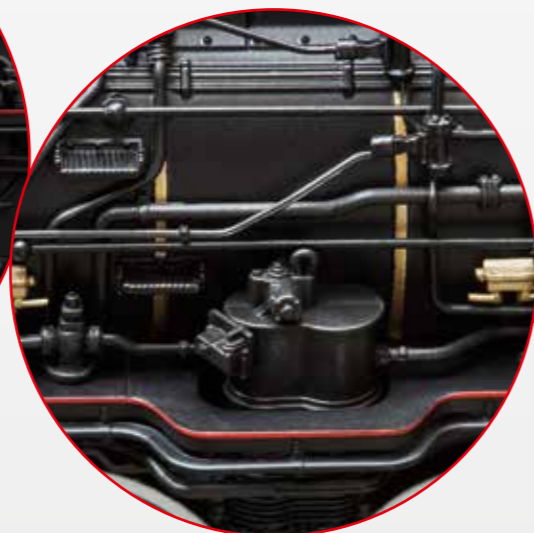
Äußerst filigrane Leitungsführung wie am Original