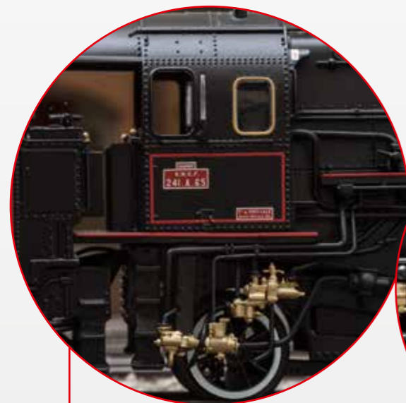
Auch auf den zweiten Blick... Schönheit mit vielen goldfarbenen Details

The massive class 241 A steam locomotives appeared on French rails at the start of the Thirties. In the "golden" era of travel before World War II, they pulled heavy express trains between Paris and the Atlantic ports of Cherbourg and Le Havre as well as between Paris and Basle. There the famous Arlberg Orient Express was part of their tasks. After the end of the war, they ran until 1965 mainly between Paris and Strasbourg as well as Paris and Basle. Road number 241 A 1 in the Mulhouse Railroad Museum as well as road number 241 A 65 in Switzerland remain preserved, the latter as the largest operational steam locomotive in Europe.