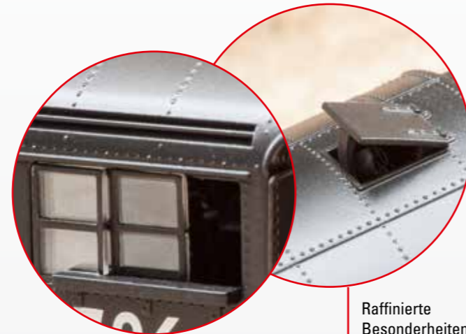
Raffinierte Besonderheiten sind die zu öffnenden Fenster und die Frischluftklappe

The "Challenger" type steam locomotive celebrated their hour of birth on the Union Pacific Railroad (UP). In the beginning the Challengers pulled chiefly freight trains over the grades on the Wasatch Mountains and Sherman Hill, but after the still more powerful Big Boys were placed into service, they were seen on the entire UP system in California, Nebraska, Oregon, Utah, and Wyoming. In addition, they were also used for a time to pull passenger trains such as the "Challenger Streamliners" of the same name between Chicago and California.