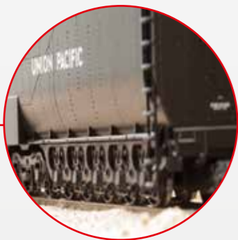
Eine gigantische Optik bietet auch der Öltender mit seinen Nietreihen