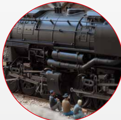
Special refined features are the windows and ventilation hatch that can be opened