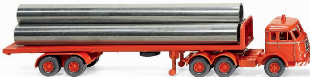
0554 04 Flachpritschensattelzug (Henschel) Typischer Stahlröhrentransport im Wirtschaftswunder 1955-61