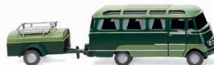
0260 04 Panoramabus mit Anhänger (MB O 319) Exquisites Reisen in den 1960ern 1955-68