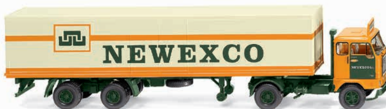
0542 02 Koffersattelzug (Volvo F88) Schweden-Power für internationalen Logistiker 1965-70