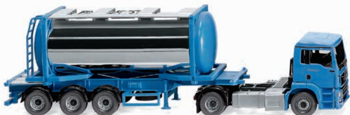
0536 05 Tankcontainersattelzug Swap (MAN TGS Euro 6c) Topaktueller Flüssiglogistik-Auflieger