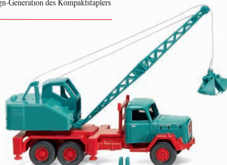
0662 04 Kranwagen (Magirus/Fuchs) Allzweck-Kran-Klassiker 1958-64