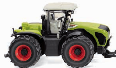
0363 97 Claas Xerion 4500 Radantrieb Systemschlepper für schwere Agraraufgaben