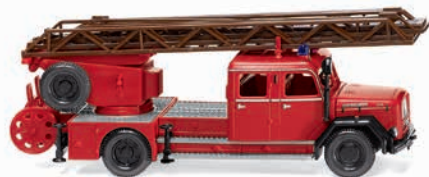
0862 33 Feuerwehr – Drehleiter DL 25h (Magirus) Eckhauber-Legende der städtischen Löschzüge 1962-65