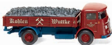
0476 04 Pritschen-Lkw (Büssing 4500) Der Kohlenhändler am einstigen Berliner Stammsitz 1953-55