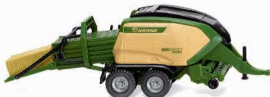
0384 05 Krone Big Pack 1290 HDP VC Großpackenpresse Der Leistungsträger im Ernteeinsatz