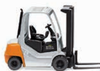
0663 37 Gabelstapler Still RX 70-25 Neueste Design-Generation des Kompaktstaplers