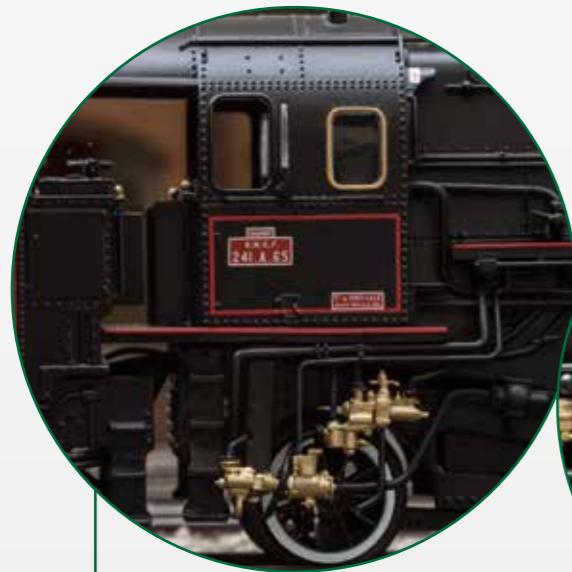
Auch auf den zweiten Blick... Schönheit mit vielen goldfarbenen Details

The massive class 241 A steam locomotives appeared on French rails at the start of the Thirties. In the "golden" era of travel before World War II, they pulled heavy express trains between Paris and the Atlantic ports of Cherbourg and Le Havre as well as between Paris and Basle. There the famous Arlberg Orient Express was part of their tasks. After the end of the war, they ran until 1965 mainly between Paris and Strasbourg as well as Paris and Basle. Road number 241 A 1 in the Mulhouse Railroad Museum as well as road number 241 A 65 in Switzerland remain preserved, the latter as the largest operational steam locomotive in Europe.