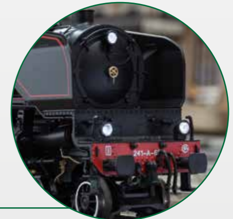
Eine Lok wie ihre Zeit... Gigantische Schönheit